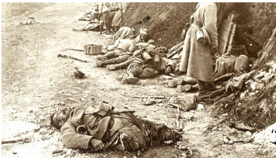
↙ ayant eu les membres inférieurs arrachés à mi-cuisses, ce brave soldat est mort vidé de son sang